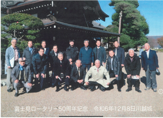
富士見ロータリー50周年記念 令和6年12月8日川越城